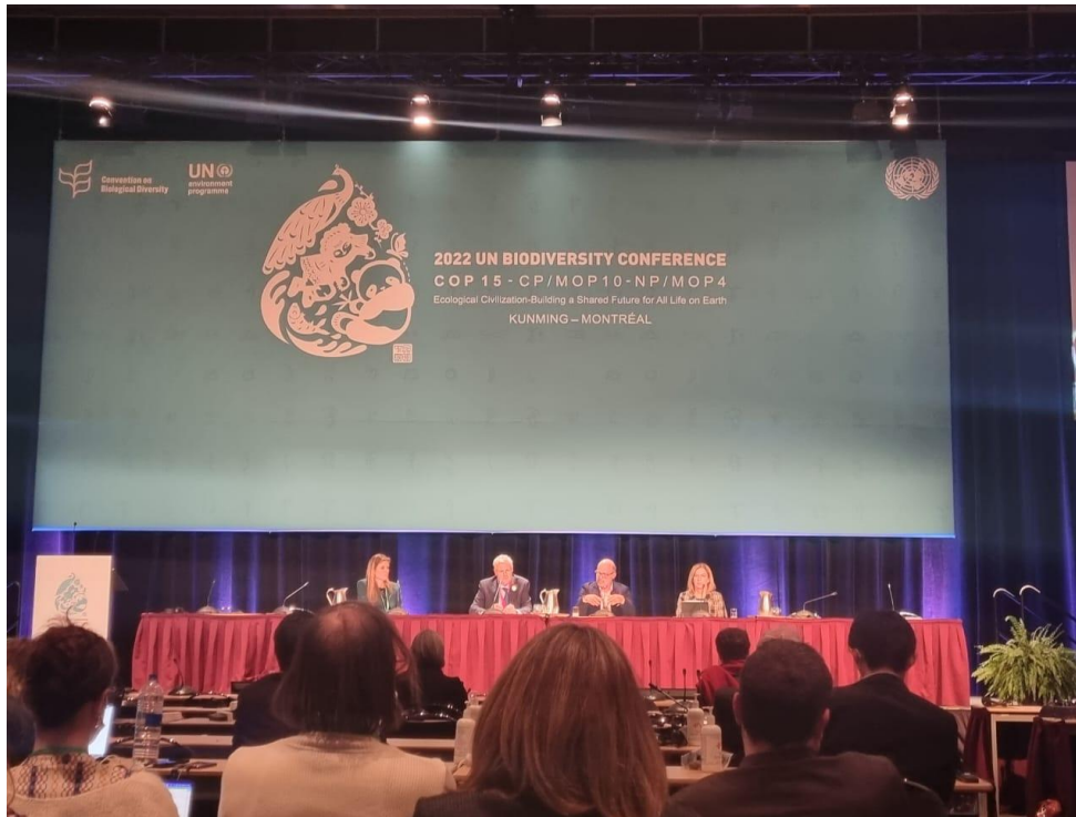
Figura 2 - Negociações do Marco Global da Biodiversidade durante a COP 15 em Montréal em dezembro de 2022